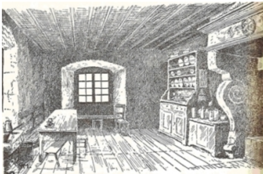
Château de Raymontpierre. Salle des chevaliers

Et comme un bonheur n'arrive jamais seul, Georges Hugué, à l'époque où il devenait possesseur du Raimeux, était élevé dans la noblesse impériale par l'empereur Rodolphe II. Selon une lettre de noblesse, conservée en copie aux archives de Berne, il obtenait pour lui et ses descendants, en ligne mâle, l'insigne honneur de s'appeler de Remontstein ou de Raymontpierre. Ses armes étaient d'or à la bande d'azur accompagnée de 2 feuilles de trèfle de sinople, l'une en chef, l'autre renversée en pointe ; l'écu timbré d'un heaume de chevalier et surmonté de 2 cornes de buffle d'or à la bande d'azur, scellé de 6 feuilles de trèfle de sinople.