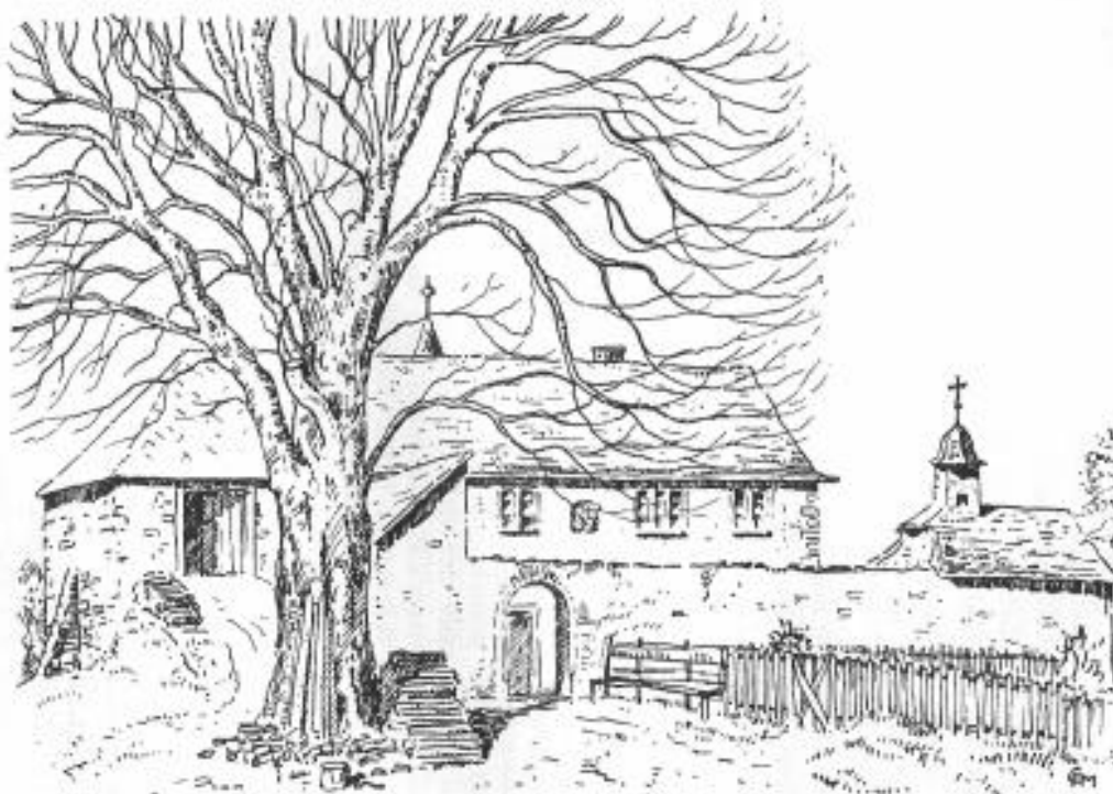
Remontstein, Hauptfassade, Linde, Tor und Kapelle.